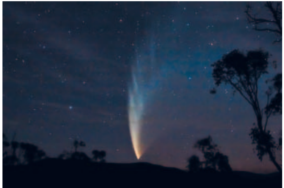
Fig. 4: La comète McNaught (C/2006/P1), photographiée le 23 janvier 2007 à Swifts Creek en Australie.