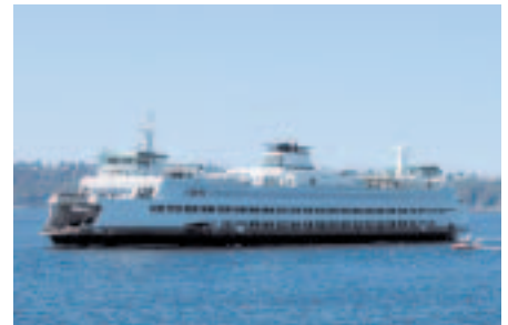
Fig. 2: Le «Tacoma», utilisé sur plusieurs routes des Washington State Ferries. Son nom est dérivé du terme «Tah-ho-mah» (montagne enneigée) utilisé par les indiens natifs pour le Mont Rainier.

s'était ensuite installé dans une atmosphère purifiée et un ciel totalement dégagé. La «skyline» de Seattle brillait sous les rayons du soleil de cette fin d'après-midi de janvier. Plus loin vers le sud, le Mont Rainier 1 était exceptionnellement bien visible par dessus les stades sportifs.