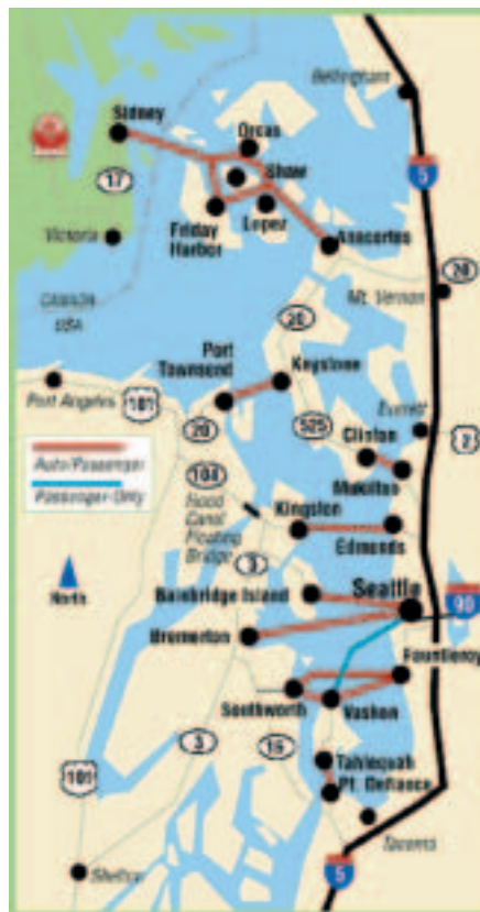
Fig. 1: Les routes des Washington State Ferries dans le Puget Sound. Jim McCullogh revenait d'une journée passée sur la Bainbridge Island. (© Washington State Ferries)

JIM McCULLOGH quitta le ferry Tacoma qui venait d'accoster au Pier 52 de Seattle. Le temps était superbe. Une vague de nuages avait brusquement débarqué la veille d'Alaska et avait rapidement recouvert la région d'un manteau blanc avant de disparaître. Un froid polaire