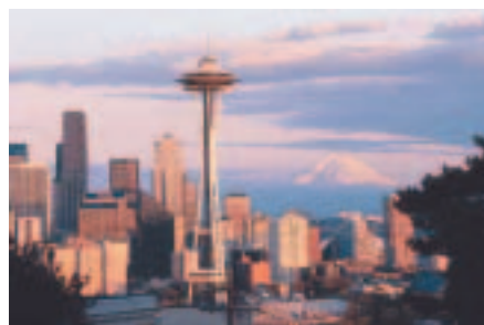
Fig. 3: Vue de Seattle avec le Mont Rainier en arrière-plan et, au premier plan, la célèbre «Space Needle» (Aiguille Spatiale), vestige de l'exposition universelle de 1962 et identifiable dans de nombreux films et séries télévisuelles tournés dans la ville.

car l'air commençait vraiment à fraîchir avec un soleil de plus en plus bas sur l'horizon.